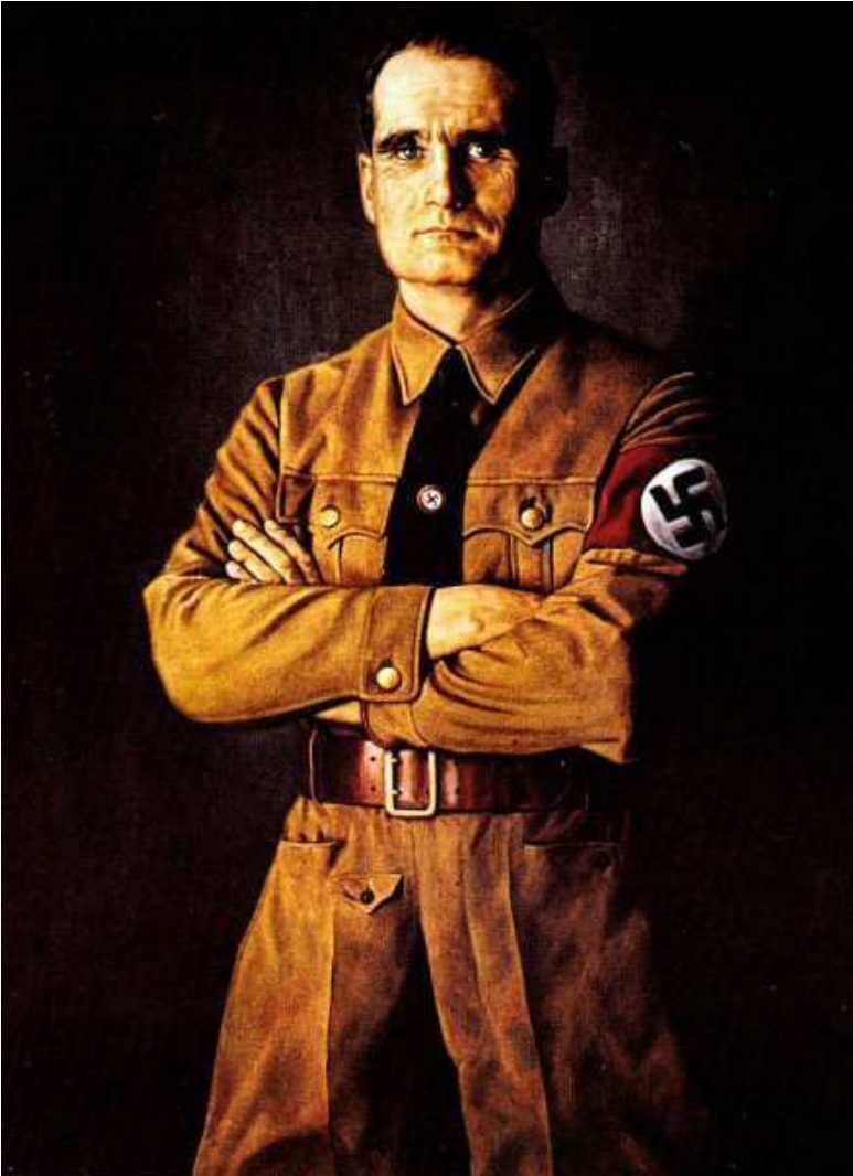
Rudolf Hess martire per la pace

d'Arabia erano filo-nazisti. Laurence è stato assassinato durante il viaggio per un importante meeting per contribuire a portare un trattato di pace con la Germania prima della guerra.