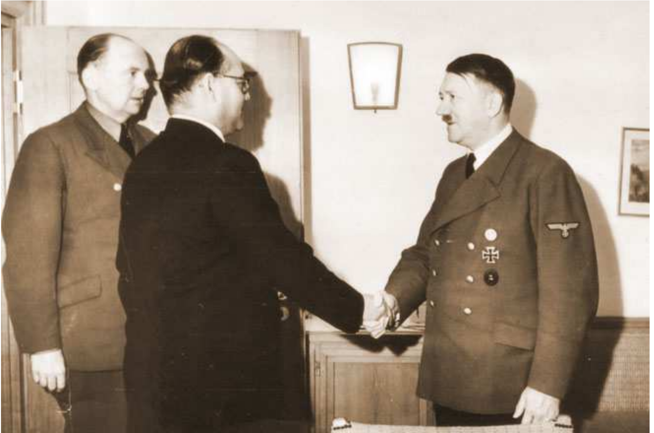
Hitler incontra l'eroe e leader Nazionalsocialista Indiano Chandra Bose.

Il famoso leader Indiano Nazionalista Subhas Chandra Bose si incontrò personalmente sia con Hitler che con Himmler ed ha parlato anche alle maggiori riunioni dei leader dell'Asse in Europa ed è stato ricevuto da loro come un eroe. Bose è andato alle migliaia di prigionieri di guerra indiani in custodia presso i tedeschi catturati come parte dell'esercito britannico in Nord Africa che avevano rifiutato di rompere il loro giuramento di servizio in Inghilterra. Dopo aver parlato con loro e aver raccontato la verità migliaia di indiani volontariamente si arruolarono per combattere per il Nazionalsocialismo e divennero Nazionalsocialisti, come Bose stesso in sostanza era. Erano trattati alla pari dai Tedeschi. Bose aveva anche voluto modellare aspetti importanti della Germania Nazionalsocialista per la nuova nazione Indiana che sperava di creare. Oggi in tutta l'India ci sono migliaia di murali dedicati a Bose, che è un eroe celebrato, molti murali raffigurano l'incontro iconico di Bose con Hitler che si stringono la mano.