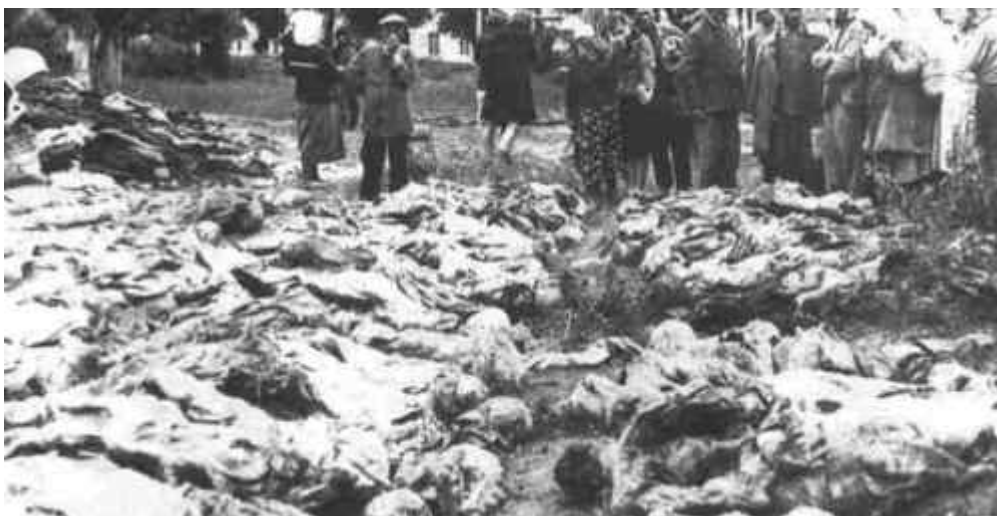
Foto di una delle fosse comuni scoperte in Ucraina. Questa conteneva i corpi di diecimila vittime tutti assassinati dalla NKVD ebraica a Vinnitsa.

Così la guerra orientale cominciò perché i Giudei la cominciarono. L'esercito dell'Asse è stato accolto come un liberatore attraversando i popoli orientali. Avevano liberato le genti dal dominio ebraico sotto il comunismo, che aveva già ucciso oltre 20 milioni di Gentili innocenti. Sette milioni di morti nel solo l'olocausto Ucraino che è stato supervisionato dal Ebreo Lazar Moiseyevich Kaganovic su ordine dell'Ebreo Stalin. Altri milioni di morti in un sistema di campi di sterminio chiamato Gulag, ciascuno gestito da un commissario ebreo. Gli ebrei semplicemente li facevano lavorare fino alla morte perché fucilarli sarebbe stato troppo veloce.