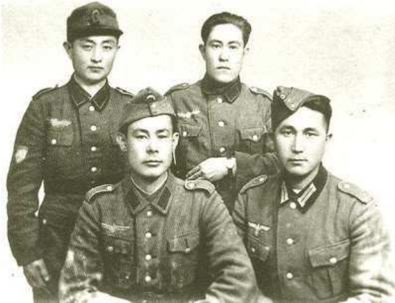
Truppe Asiatiche che combatterono nelle forze di Hitler