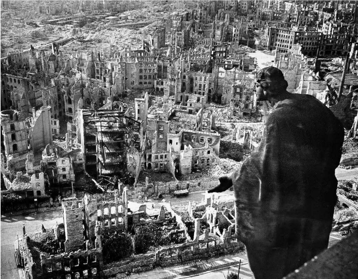
Dresda dopo l'Attacco Alleato

state strappate dai loro corpi e rotolate via In alcuni punti i cadaveri erano così fitti che ho dovuto creare un percorso attraverso di loro per non calpestare le braccia e le gambe". Kurt Vonnegut era un prigioniero di guerra americano detenuto a Dresda quando fu bombardata nel 1945, e scrisse un famoso romanzo contro la guerra, Slaughterhouse Five [dal nome della zona si rifugiò per sopravvivere al bombardamento della città]. Egli ha dichiarato che la città dopo l'attacco sembrava la "superficie della luna".