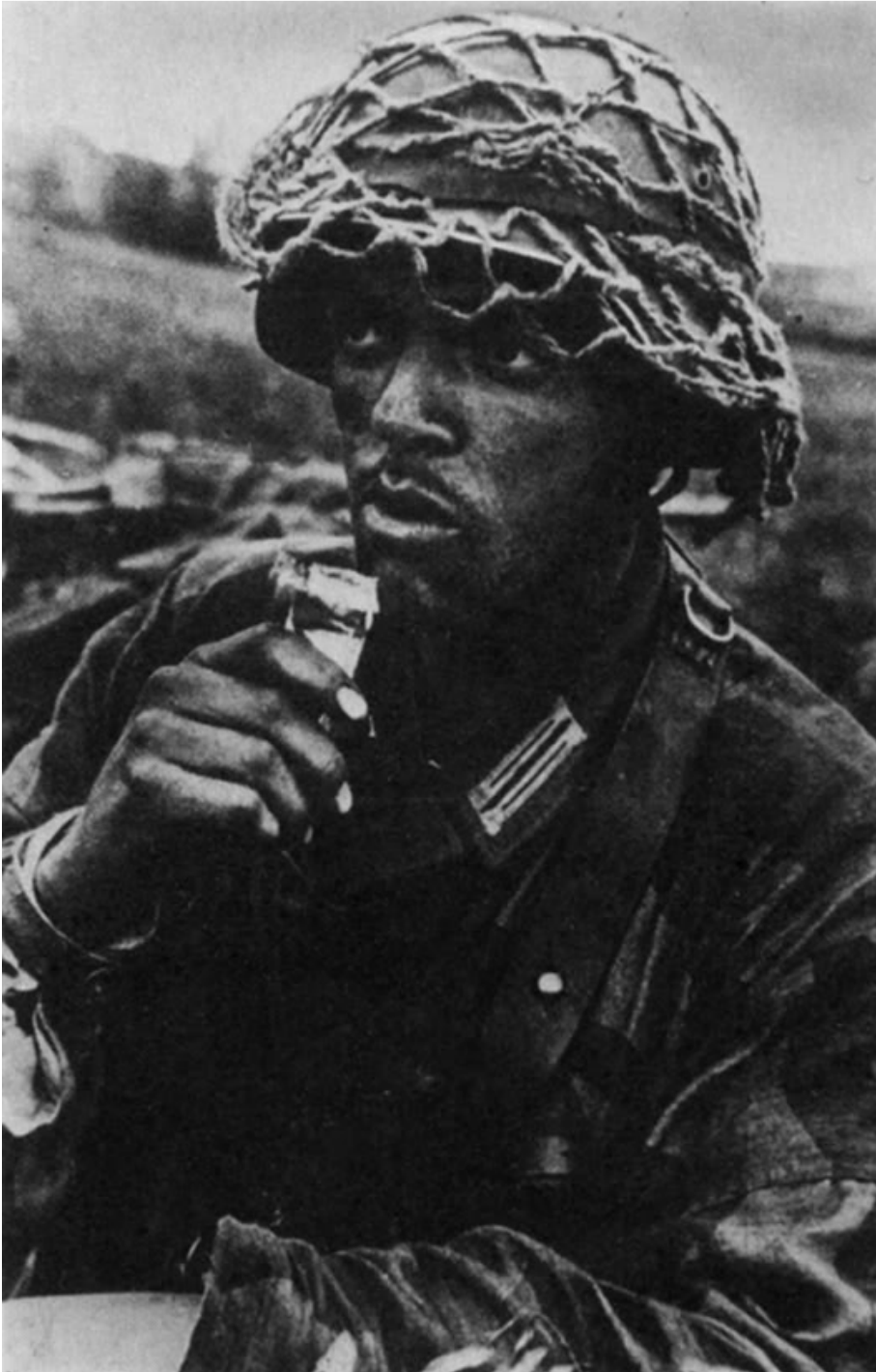
Soldati Neri nelle truppe di Hitler.

In memoria di un soldato nero che ha servito in combattimento come soldato nell'esercito di Hitler si decise che i soldati Bianchi e Neri condividessero le stesse caserme, mangiassero allo stesso tavolo mensa e avessero uguali diritti e rispetto.